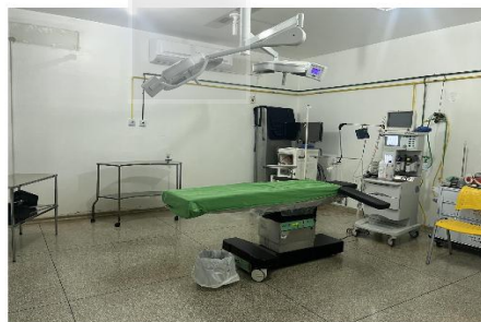
Figura 3 (Sala Cirúrgica)