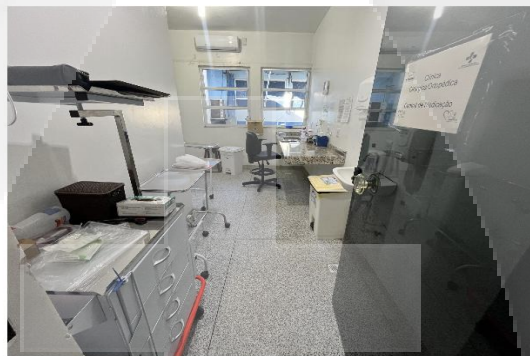
Figura 2 (Sala de medicação)