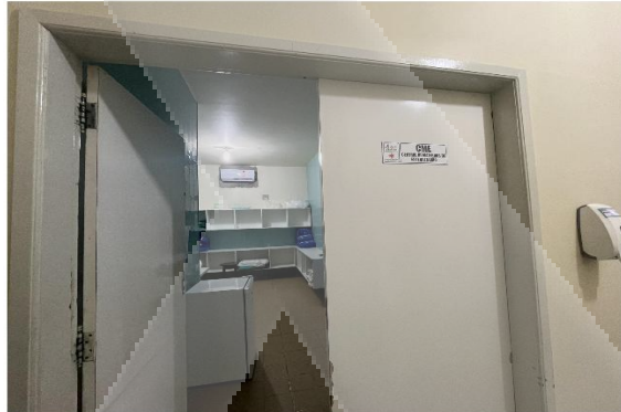
Figura 4 (CME)