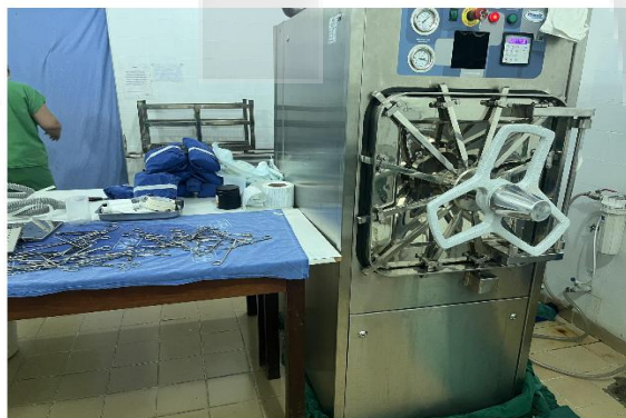
Figura 6 (Autoclave)