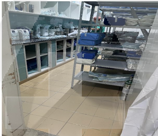
Figura 5 (CME materiais)